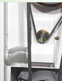
◆外気取り入れ吸引口