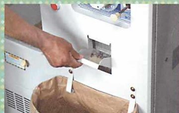
◆戻し万石 ワンタッチで戻せます。