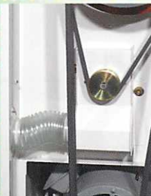
◆外気取り入れ吸引口