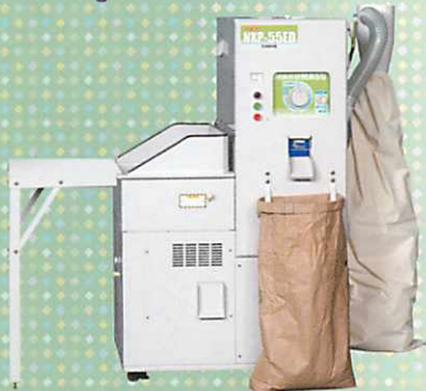
NXP-33EB・ED / 55EB・ED型兼用オプション