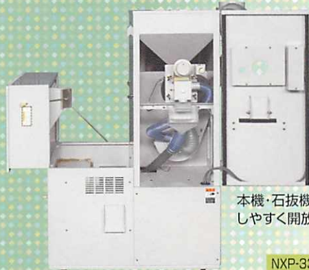
本機・石抜機・メンテ しやすく開放できます。