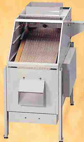
高精度超ロングスクリーン P-35型自動間歇排出装置付