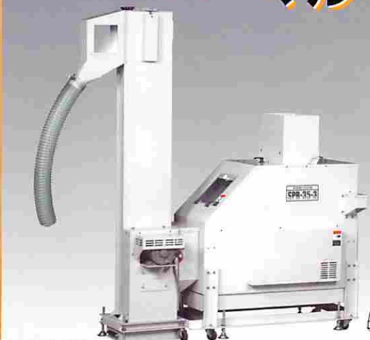
ベース幅 440mm 長さ 1250mm